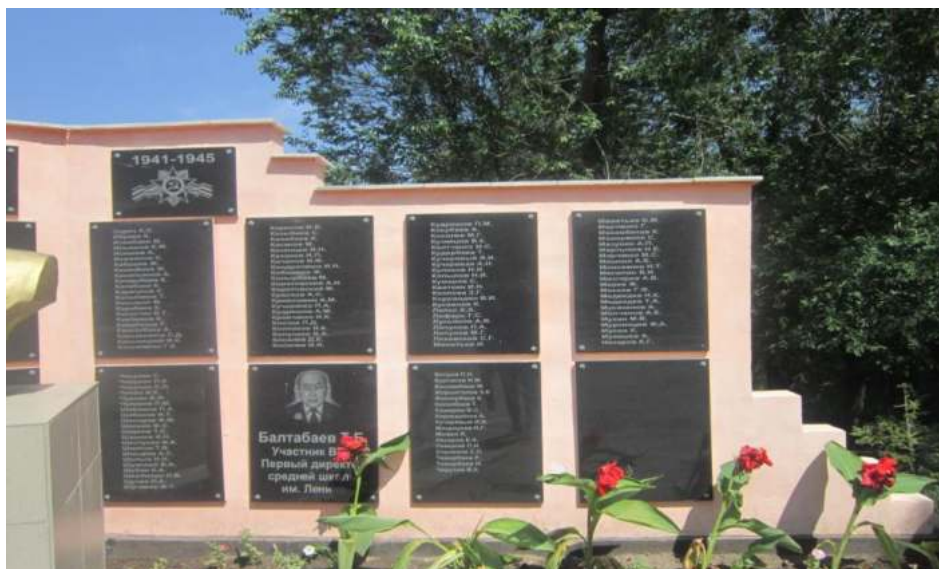
Стена памяти участникам ВОВ