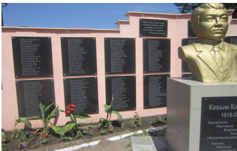
Стена памяти участникам ВОВ